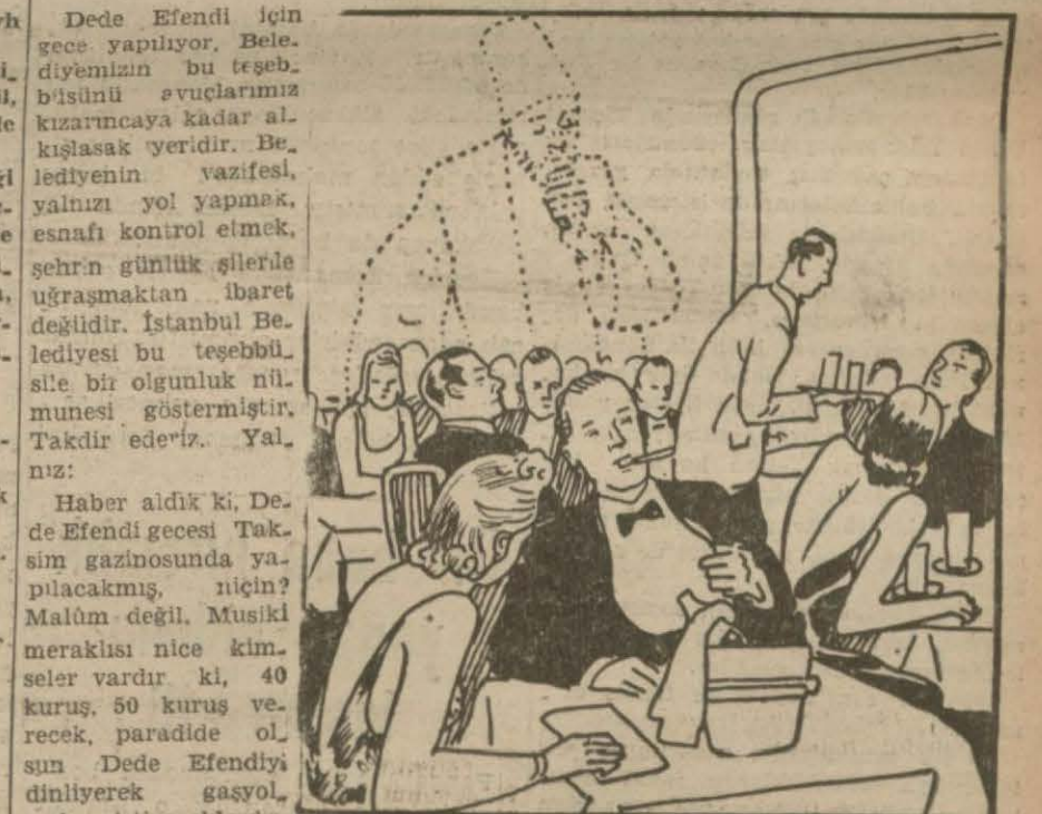
Bu vatandaşlar Tak-sim gazinosuna gidebilirler mi?

Dede Efendinin asıl hayranları, Tak-sim gazinosunun müdavimleri arasında değildir. Sonra en mühim mesele bizim bildiğimiz Dede Efendi gazinoda dinlenmez. Böyle yaparsak al-sun Dede Efendi dinliyerek gasyol-mak istiyecelerdir.